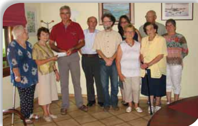
Remise d'un don de 1000 € à la commune par le 3 e âge