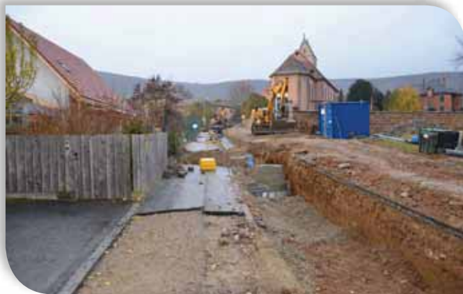
Aménagement de la rue de l'Automne