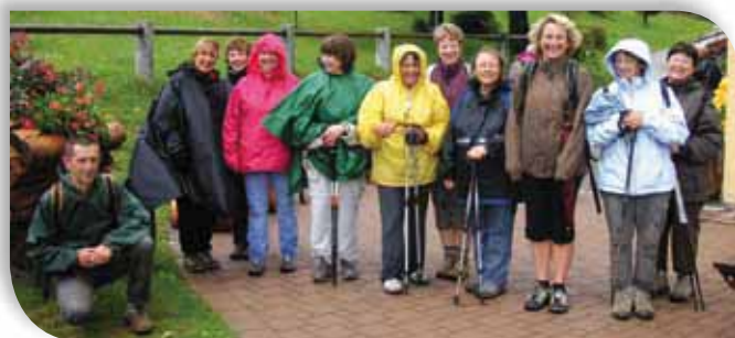
Randonnée de la Gymnastique d'Orschwihr au Schnepfenried