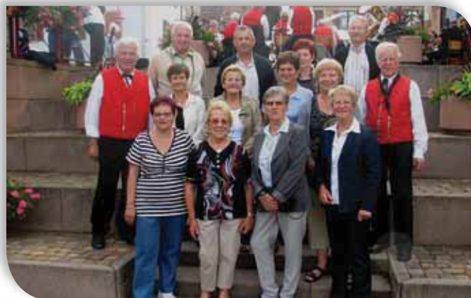
L'équipe des quêteurs contre le cancer lors de la Fête de la musique le 20-6-2011