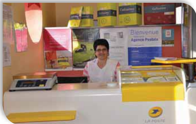
Ouverture du dépôt de pain et de l'agence postale