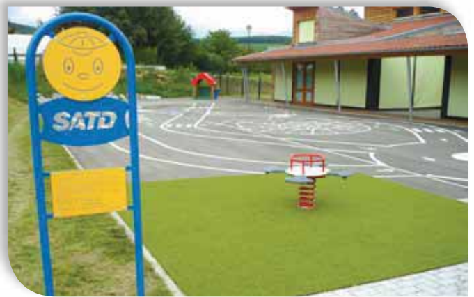
Installation de nouveaux jeux dans la cour de l'école maternelle