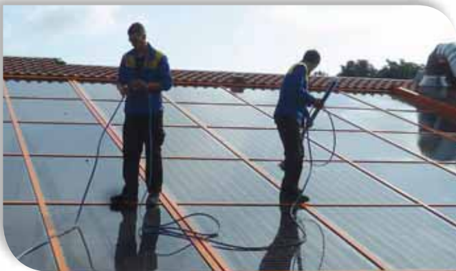
Nettoyage des panneaux photovoltaïques