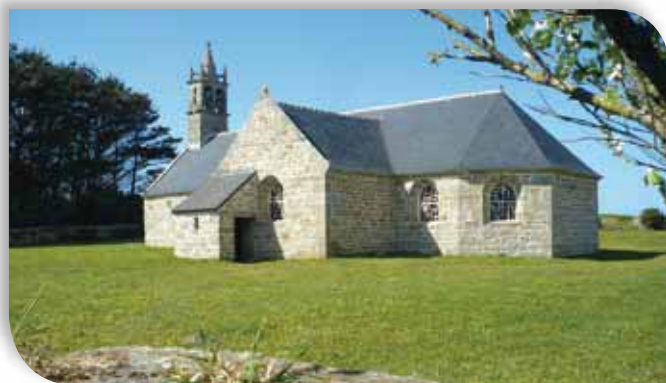
Découvrez Kerlouan et ses environs