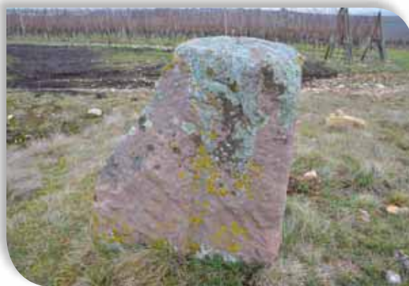
Borne médiévale au pied du Bollenberg sur laquelle on distingue la crosse de l'évêque.

L'importante vocation viticole d'Orschwihr est également évoquée comme une trace de ce passé. En attendant le prochain rendez-vous des 15 et 16 septembre 2012, nous vous invitons à consulter le programme du Pays d'Art et d'Histoire qui propose tout au long de l'année des visites guidées et des conférences qui vous permettront de découvrir ou de redécouvrir les richesses historiques et les perles de notre patrimoine.