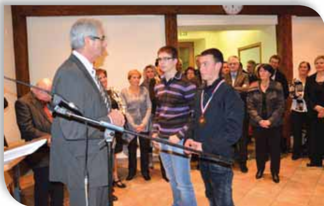
Cérémonie des vœux du nouvel an le 7-1-2012