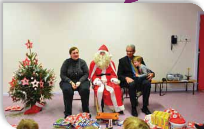
Visite du St Nicolas et du Père Noël