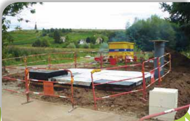
Interconnexion réseau d'eau Orschwih-Bergholtz-Zell