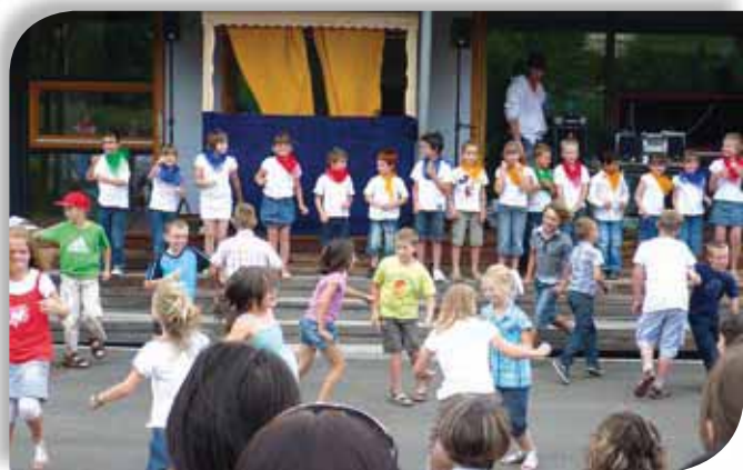
Kermesse au groupe scolaire le 24-6-2011