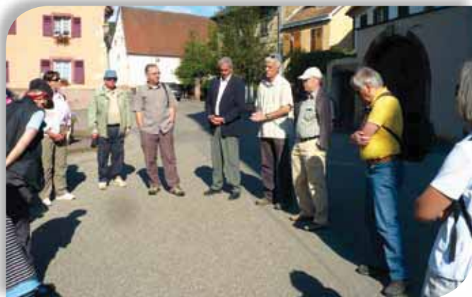
Sortie RIN le 12-6-2011