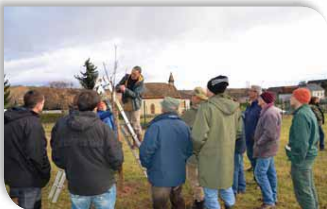
Taille des arbres au verger communal