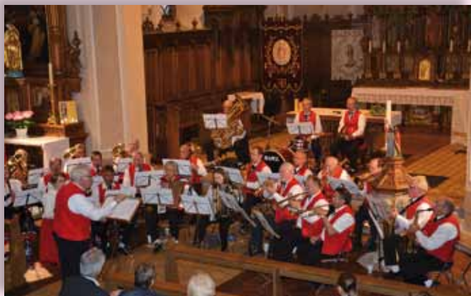
Concert à l'église le 08/05/2012