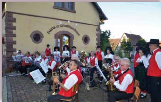
Fête de la musique le 20/06/2012