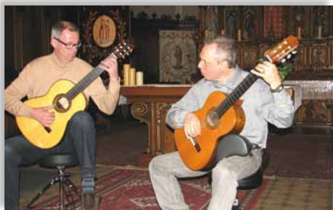
Concert de guitare classique donné par Duo des 6 à l'Eglise d'Orschwihr le 27/05/2012