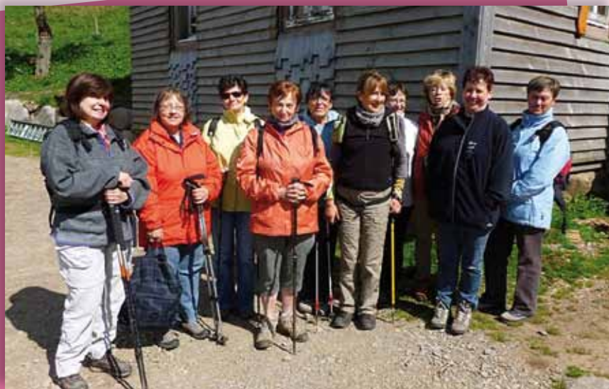
La randonnée de printemps 2012 de la GV au Petit Ried

La gymnastique d'Orschwihr reprendra ses activités mercredi le 12 septembre à 19h30 Salle St Nicolas.