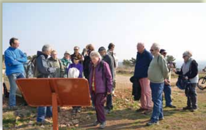
Sortie RIN à ORSCHWIHR le 25/03/2012 et le 03/06/2012