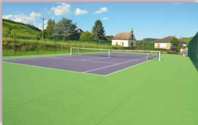
Tournoi des jeunes et inauguration du terrain refait à neuf le 7 juillet 2012.