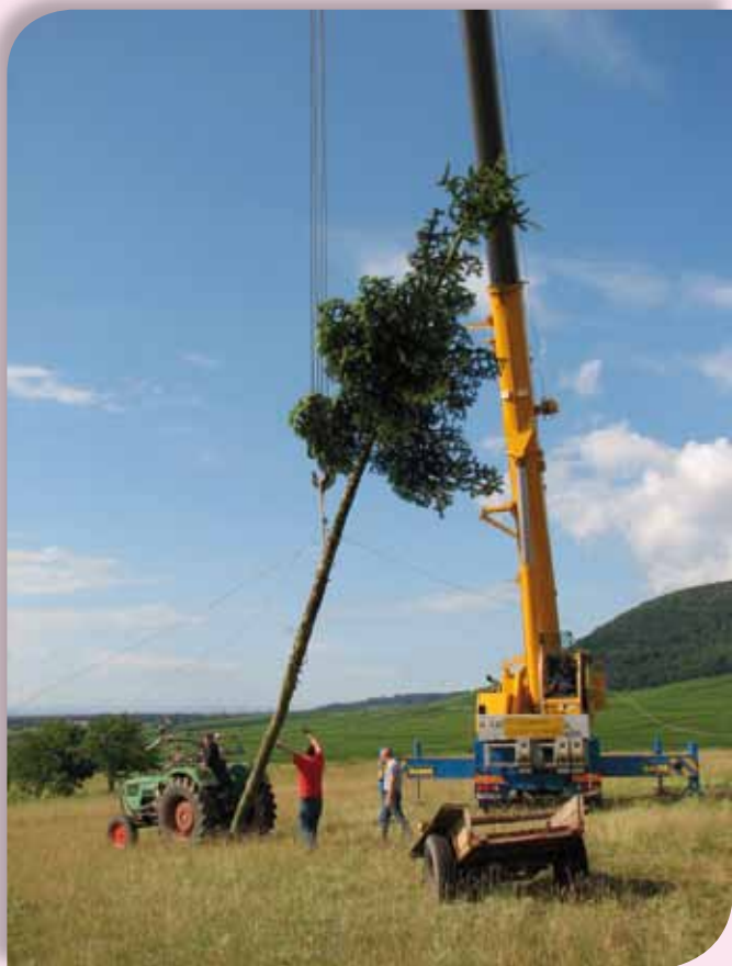
Préparation du Haxafir par les pompiers du SIVOM