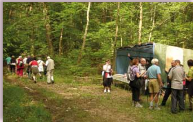
Marche populaire les 26/27 Mai 2012