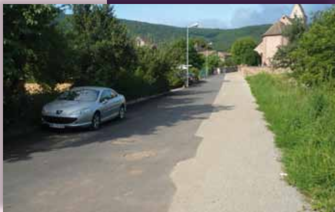
Aménagement de la rue de l'Automne avec revêtement provisoire.