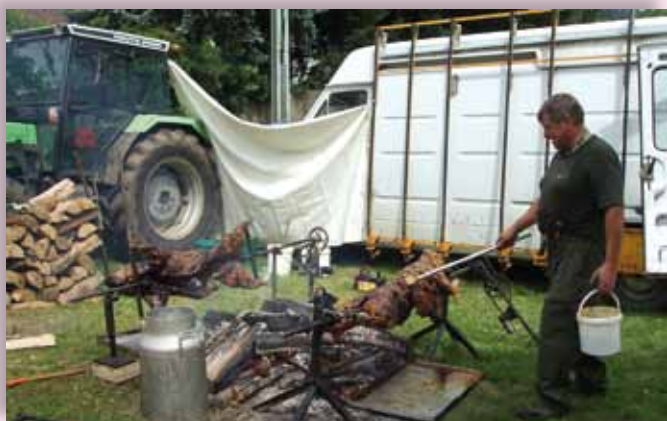
Sanglier à la broche à l'occasion du 25 ème anniversaire de l'Echo du Bollenberg