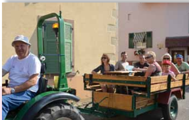
Passage du jury du fleurissement le 27/07/2012