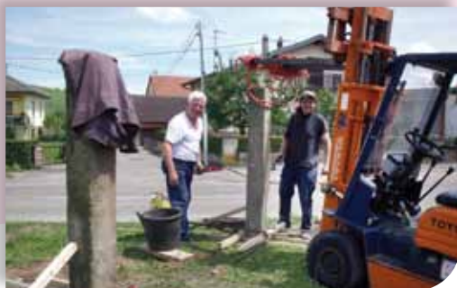
Aménagement de l'entrée nord du village