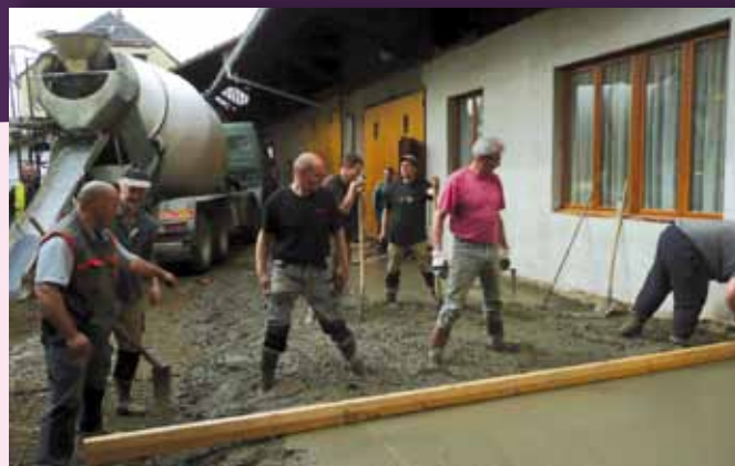
Réfection de la cour de l'atelier communal