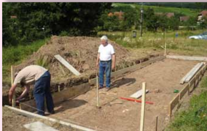
Préparation de la plateforme pour conteneurs à vêtements, déchets DASRI et piles usagées pour les deux communes près du groupe scolaire.