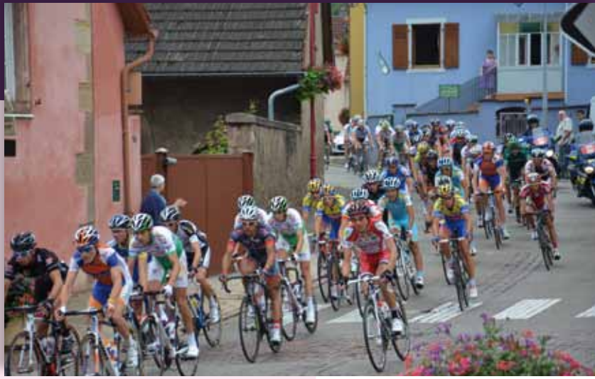
Passage du tour d'Alsace le 28/07/2012