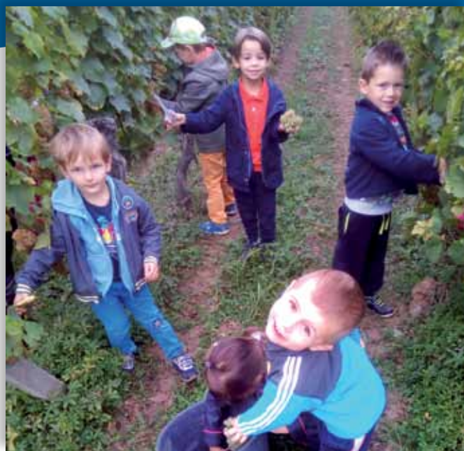
Les écoliers aux vendanges