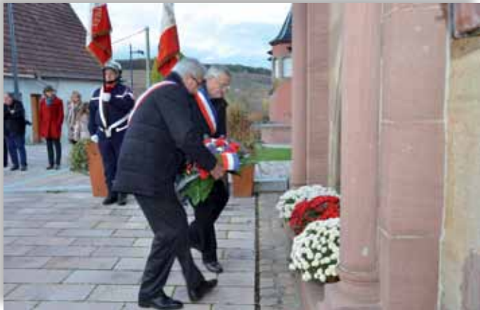
Dépôt de gerbe le 11-11-2016