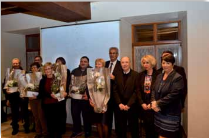
Cérémonie des Vœux