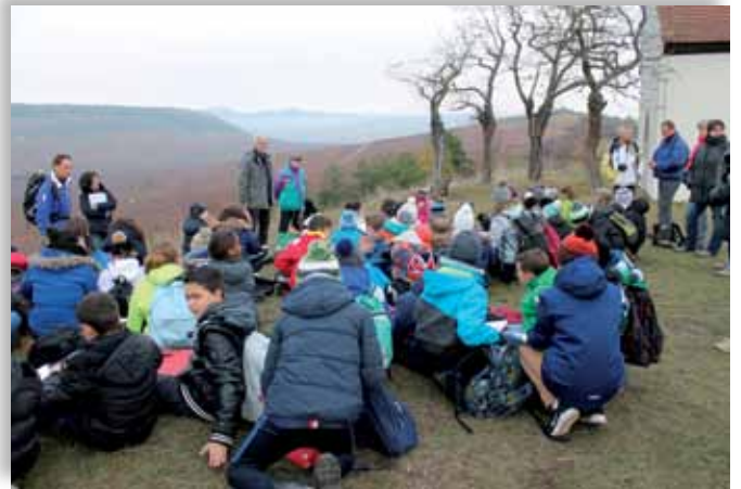
Les 6 e du Collège Champagnat en visite