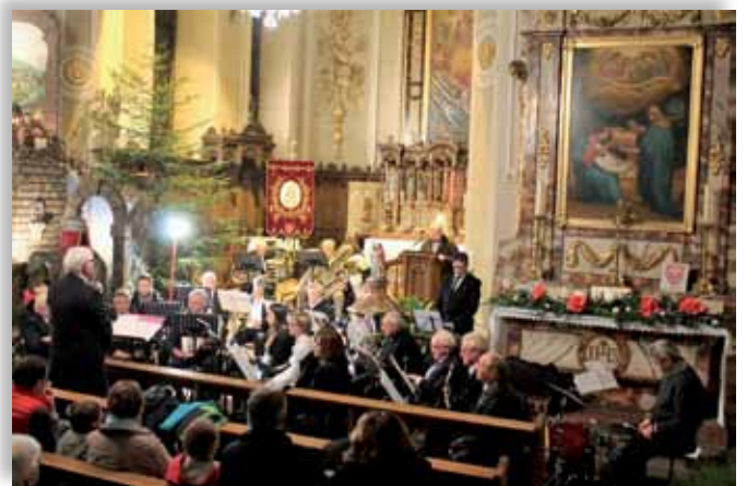
Concerts Chœur de femmes et Echo du Bollenberg à l'église St Nicolas