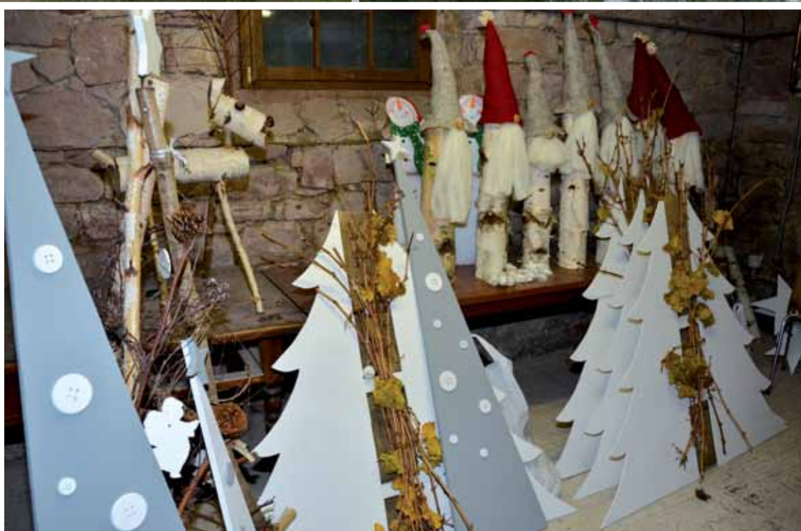
Décor de Noël réalisés par les membres du conseil municipal