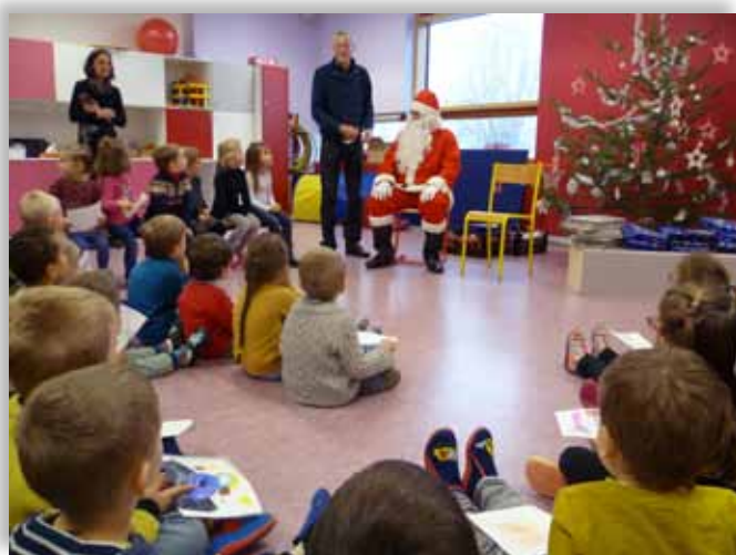
Passage du St Nicolas et du Père Noël