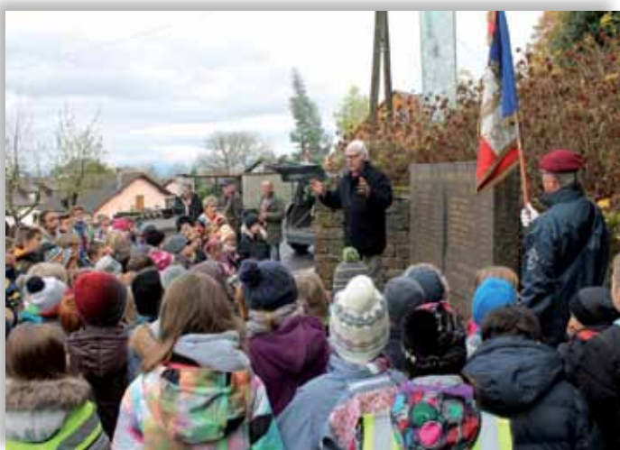
11 Novembre avec les Ecoliers