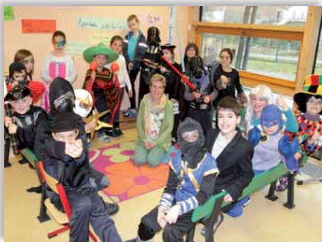
Carnaval à l'école