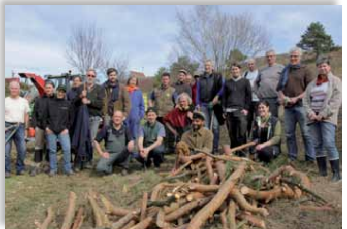
Chantier nature au Bollenberg