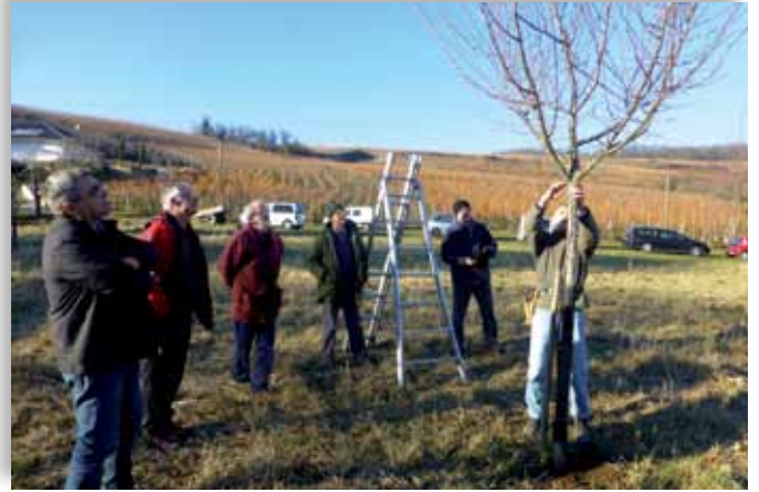
Taille d'hiver au verger communal